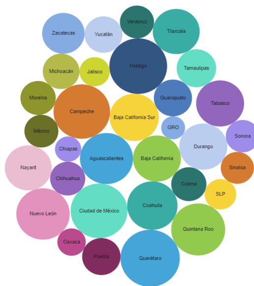
Figura 3: Validación de proyectos en las entidades federativas*

*Un área mayor significa un mayor esfuerzo de la entidad por validar los proyectos