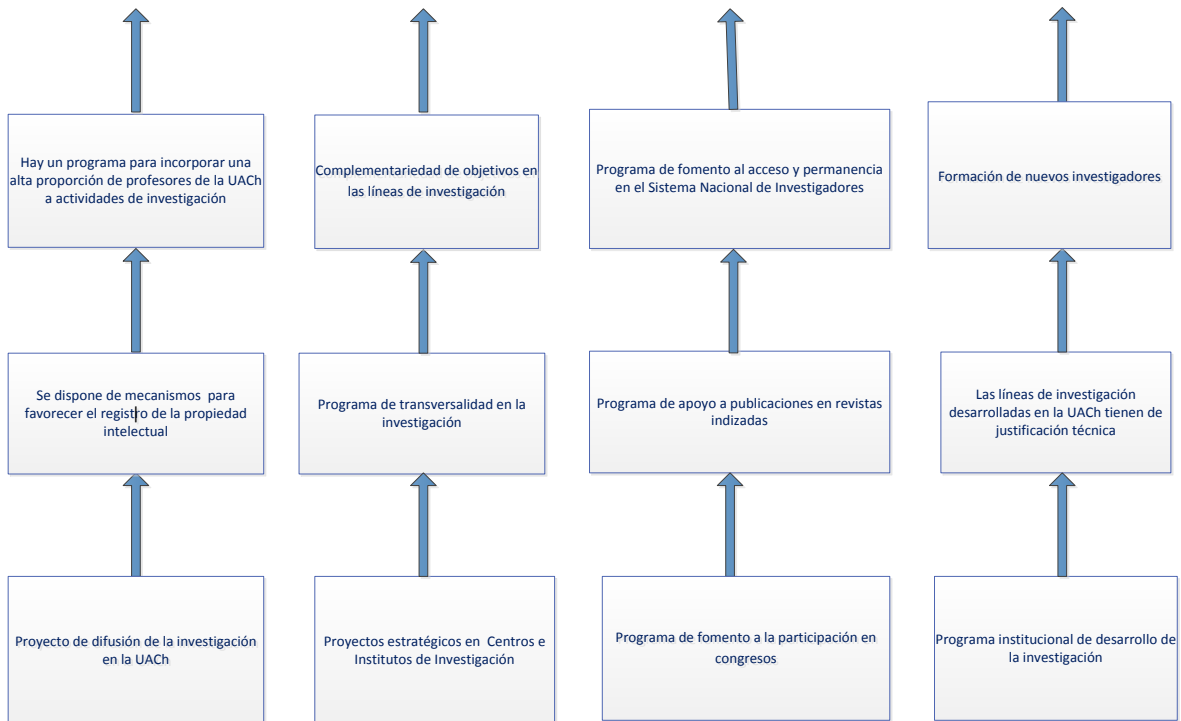
Figura 3. Acciones a desarrollar dentro del Programa E003

Con base en el ejercicio de Marco Lógico realizado, los principales objetivos del Programa E003 son los que se indicaron en la Figura 2. Para alcanzarlos, es preciso instrumentar una serie de programas al interior de la Universidad, mismos que se presentan en la Figura 3.